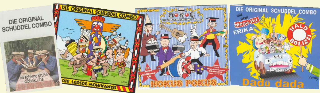
In vielen heimischen Haushalten finden sich Tonträger mit den „Köstlichkeiten“ der „Original Schüddel Combo“.

Auch die sog. „Kreissäge“ – hierbei handelt es sich um den während der 1920er Jahre in Mode gekommenen Florentiner Strohhut, der wegen seiner Kreisform und seines gezackten Randes diesen „Zweitnamen“ erhielt – wird heute zumeist nur noch bei bestimmten Musikstücken aufgesetzt.